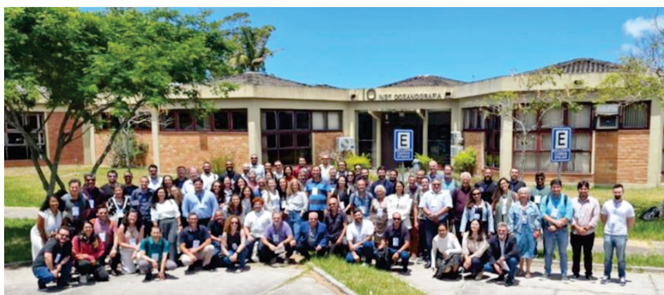
Foto oficial do 7º Encontro de Coordenadores de Cursos de Ciências do Mar.