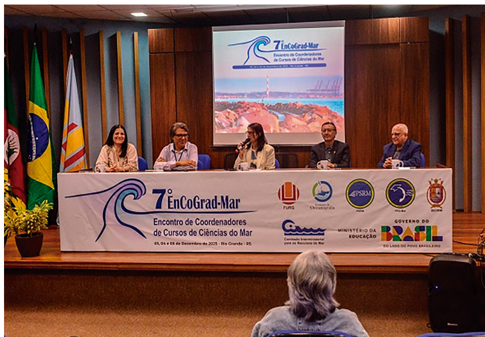
Solenidade de abertura do 7º Encontro de Coordenadores de Cursos de Ciências do Mar.

A Carta de Rio Grande, documento aprovado pelos participantes e divulgado à sociedade, destaca a importância da retomada do EnCoGrad-Mar e define as prioridades consolidadas como fundamentais para orientar a formação em Ciências do Mar em nível nacional, reforçando a expectativa de que novos eventos sejam realizados com brevidade.