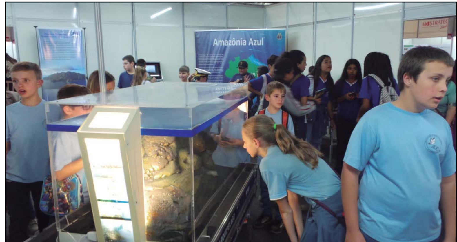
Estande do PROMAR, por ocasião da MOSTRATEC, Feira de C&T que contou com a participação de mais de 40 mil visitantes