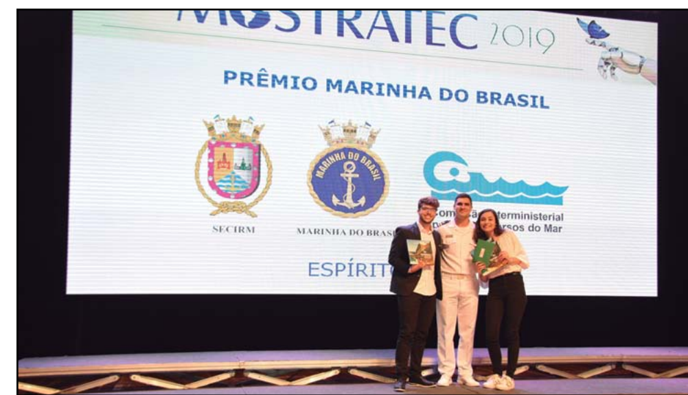
A dupla do trabalho científico vencedor da 34ª MOSTRATEC recebe o "Prêmio Marinha do Brasil de incentivo à pesquisa"

Durante o evento o PROMAR proferiu palestra para alunos de 12 a 15 anos de idade, da rede Municipal de Educação, na cidade de Bom Princípio, RS.