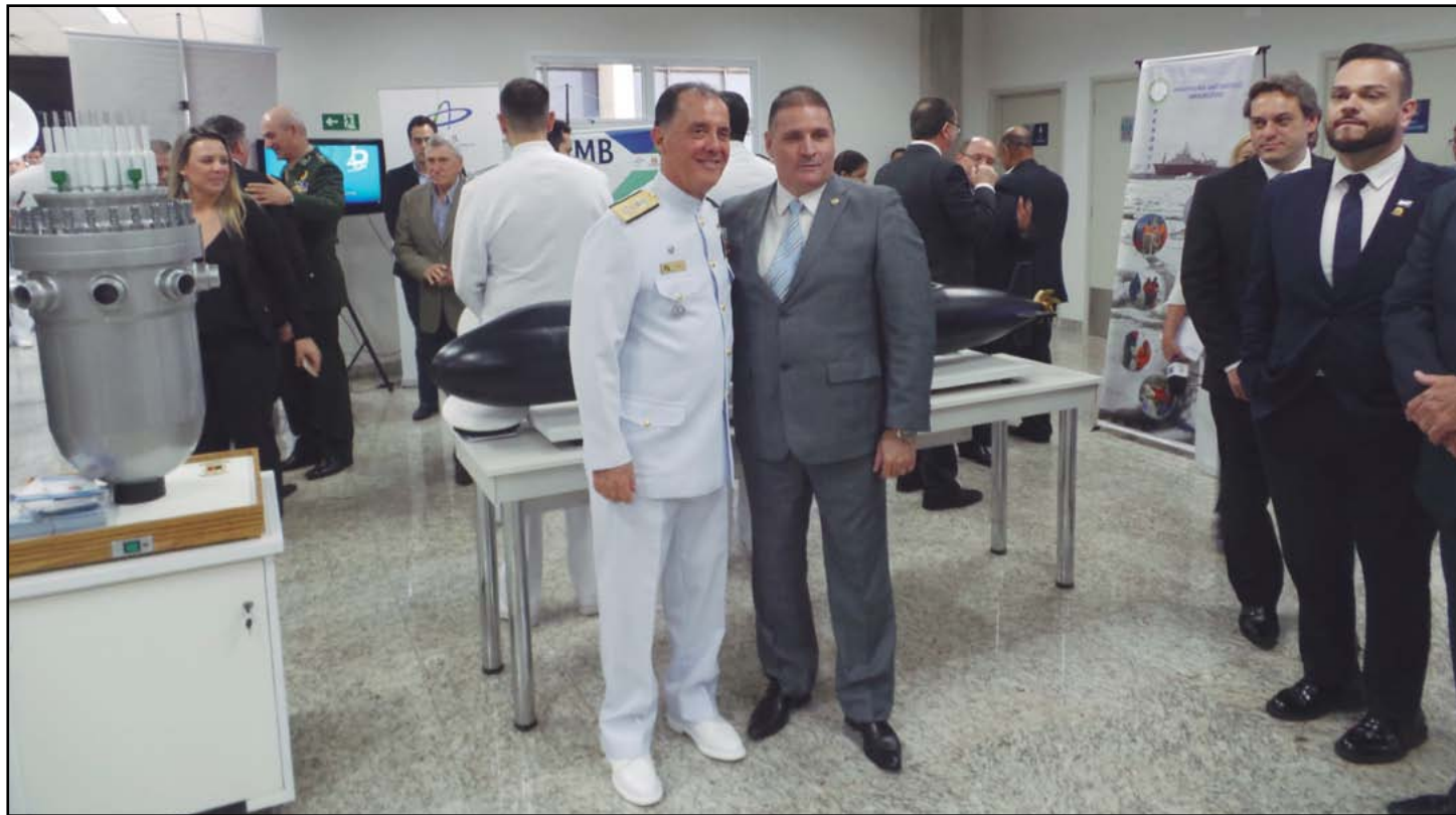
Comandante da Marinha e Coordenador da CIRM, Almirante Ilques, na exposição realizada na Câmara Municipal de Ribeirão Preto

O Programa de Mentalidade Marítima (PROMAR), com o objetivo de ampliar o conhecimento da sociedade brasileira sobre o mar, seus recursos e sua importância para o Brasil, vem divulgando junto à população, em todas as regiões do país, o conceito da Amazônia Azul e a presença Brasileira na Antártica, por meio de palestras e exposições, distribuição de livros, cartilhas e informativos, para instituições públicas e privadas, em conferências, seminários, feiras de ciências e museus relacionados ao mar.