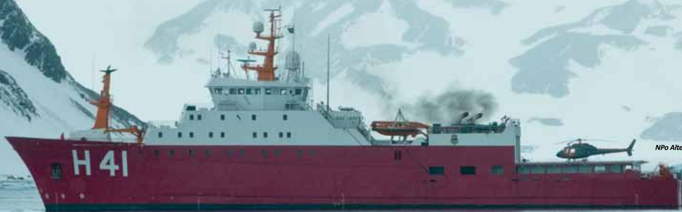
NPo Alte Maximiano