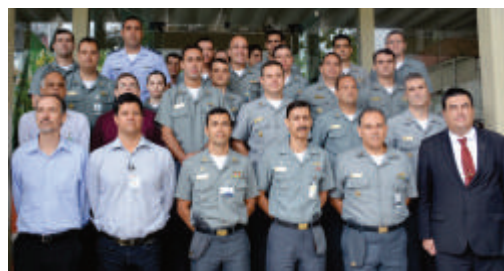
Especialistas civis e militares reúnem-se para debater as Tecnologias Nacionais para Submarinos

A interação dos diversos agentes integrantes do Sistema de Ciência, Tecnologia e Inovação da MB (SCTMB) se mostrou muito proveitosa, possibilitando o nivelamento do conhecimento e delineamento de possíveis parcerias no desenvolvimento de tecnologia nas áreas de: sensores, armas, guerra eletrônica, guerra acústica submarina, sistemas táticos, sistemas de controle da plataforma e tecnologia de materiais.