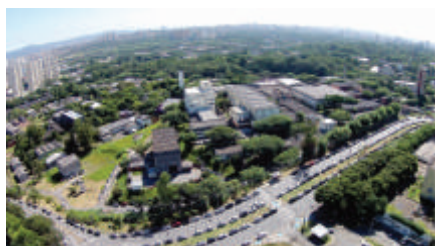
O Centro Tecnológico da Marinha em São Paulo (CTMSP)

Dentre as principais atividades dessa área, destacam-se o Desenvolvimento do Ciclo do Combustível Nuclear; a supervisão da execução do PNM, nas atividades afetas ao Laboratório de Geração Núcleo-Elétrica (LABGENE); o gerenciamento do projeto e da construção do estaleiro dedicado aos submarinos; o gerenciamento do projeto e da construção da base de submarinos; o gerenciamento do projeto e da construção do Submarino com Propulsão Nuclear (SN-BR); o gerenciamento da construção dos Submarinos Convencionais (S-BR), da obtenção de torpedos e contramedidas, e da execução das atividades de offset do PROSUB; e o gerenciamento dos recursos humanos e financeiros que suportam as atividades ligadas ao PROSUB.