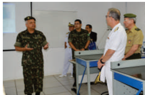
Diretor-Geral de Desenvolvimento Nuclear e Tecnológico da Marinha e comitiva visitam instalações do Centro Integrado de Guerra Eletrônica

Após dois dias de trabalhos, foram vislumbradas oportunidades mútuas em diversas áreas de atuação, destacando-se a possibilidade de trabalhos conjuntos de pesquisa básica e compartilhamento de recursos laboratoriais nas áreas de materiais absorvedores, de guerra eletrônica, de radares e de antenas; o intercâmbio de profissionais para a troca de expertises na área de Gestão da Inovação; e a realização de trabalhos conjuntos nas áreas de automação e de controle de estabilização de sistemas de armas.