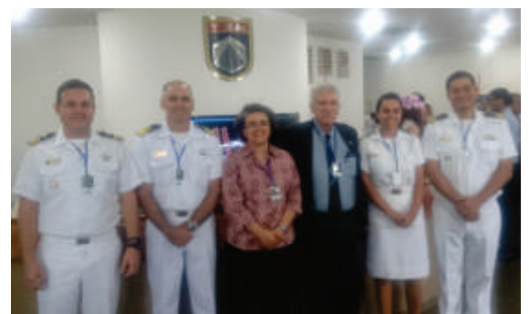
Pesquisadores do IPqM em visita ao laboratório EMBRAER durante a SERFA 2016

O laboratório EMBRAER trabalha no desenvolvimento de um “Sistema de Comando e Controle distribuído embarcado em uma aeronave de patrulha marítima que coleta dados de sensores e de outros centros, gera cenários táticos aos operadores e provê meios para interação com participantes comandados”.