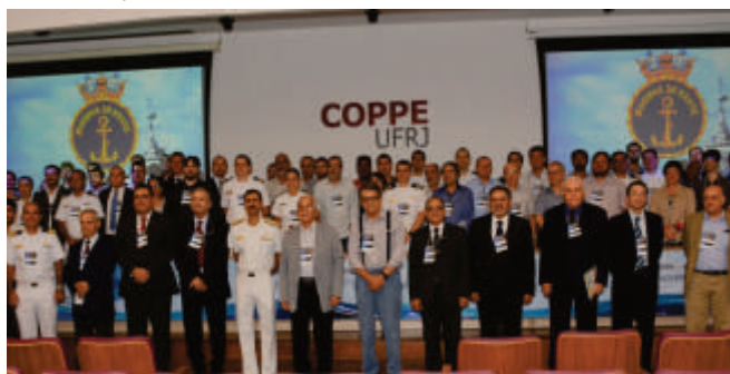
Foto Oficial do XII ETAS

O XII ETAS integrou o calendário de atividades 2016 da DGDNTM e faz parte de um projeto que busca o aprimoramento tecnológico, oriundo da aplicação do conhecimento científico, em áreas estratégicas da MB, dentre elas a de Acústica Submarina.