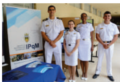
Oficiais do IPqM no estande montado no IME

A Semana Nacional de Ciência e Tecnologia, realizada desde 2004, busca mobilizar a comunidade científica e estudantil, como também valorizar a criatividade, a atitude científica e a inovação; chamar atenção da sociedade para a relevância da C&T para a vida de cada um e para o desenvolvimento do País; e contribuir para que a população possa conhecer e discutir pesquisas e suas aplicações.