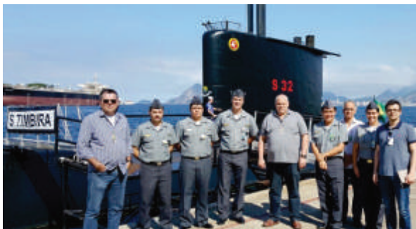
Corpo técnico do Grupo de Guerra Eletrônica e Radar do IPqM na ForSub