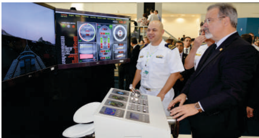
Ministro da Defesa Raul Jungmann conhece o simulador de manobra

Com o propósito de incrementar as exportações e fortalecer o mercado interno, a indústria de defesa brasileira apresentou seus produtos na 4ª Mostra Base Industrial de Defesa Brasil. Neste ano, cerca de 80 empresas participaram do evento apresentando alguns dos principais equipamentos de ponta de fabricação nacional. A mostra aconteceu entre os dias 27 e 29 de setembro em Brasília, no Centro de Convenções Ulysses Guimarães.