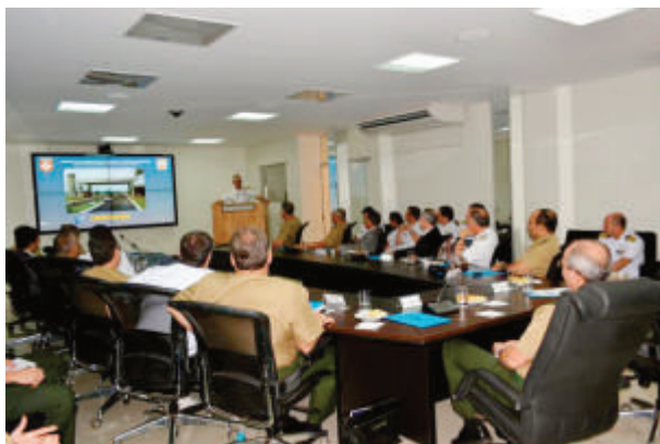
Autoridades que participaram do evento