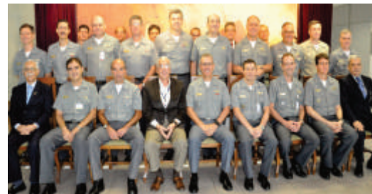
Participantes da Reunião

No evento, foram expostos e atualizados diversos assuntos de relevância para o setor de CT&I da MB, havendo recomendações atinentes, dentre outros, à obtenção e à capacitação de recursos humanos para CT&I; às atividades previstas para o setor de CT&I em 2017; e às possibilidades de interação entre a Marinha do Brasil e a Rede Nacional de Ensino e Pesquisa, organização social vinculada ao Ministério da Ciência, Tecnologia, Inovações e Comunicações (MCTIC).