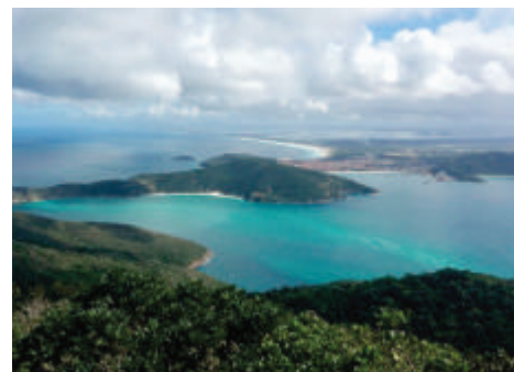
Após subida de cerca de duas horas, a deslumbrante vista do alto do Farol Velho.

Os passeios podem ser agendados pelo email ilha@ieapm.mar.mil.br , e maiores informações obtidas no site www.ieapm.mar.mil.br ou pela rede social www.facebook.com/ieapm.mb .