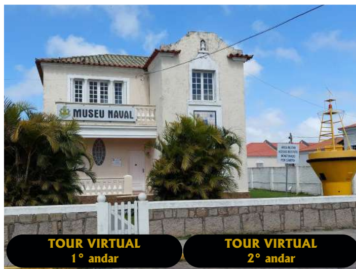
TOUR VIRTUAL 1º andar