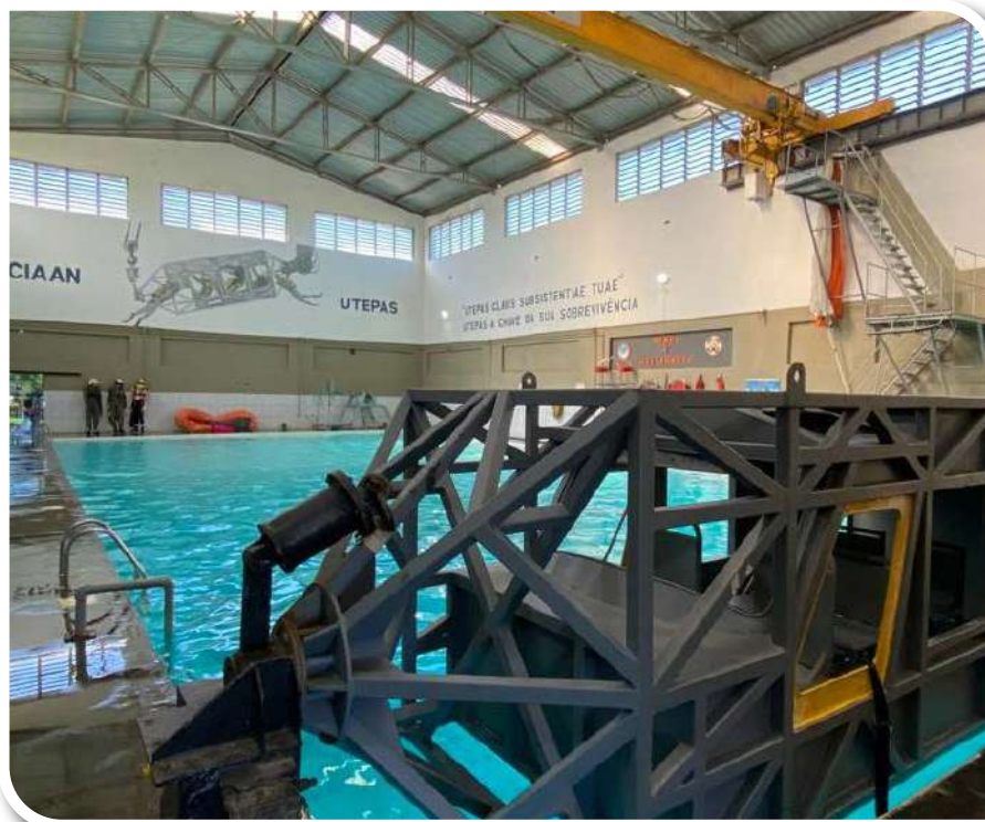
“Brasília” da Força Aérea Brasileira, com pouso final no aeroporto de Rio Grande-RS.

Os RMS são treinamentos aos quais devem ser submetidos, periodicamente, os aeronavegantes com o propósito de adestramento voltado para técnicas de eventual abandono da aeronave, seguido de sobrevivência no mar ou na selva. O traslado para a Base Aérea Naval de São Pedro da Aldeia (BAeNSPA) foi realizado por meio de voo do Programa de Missões Conjuntas, em aeronave C-97