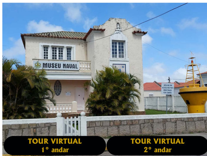
TOUR VIRTUAL 1º andar