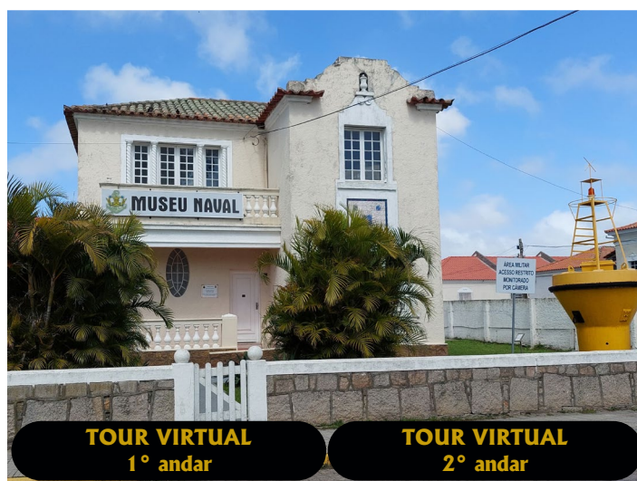
TOUR VIRTUAL 1º andar