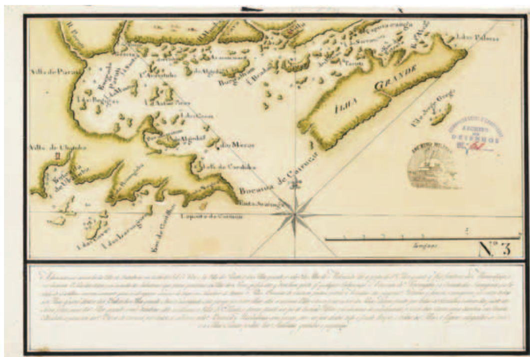
Figura 1. A demonstração acima he da villa de Ubatuba a sua costa do Sul e Norte e da villa de Parati, e da Ilha Grande. Escala [ca.1:440 000]. [ca. 1777]. 1 mapa : ms., color ; 26 x 39 cm. Direcção de Infra-estruturas do Exército, Lisboa, 4618-3-38-52.