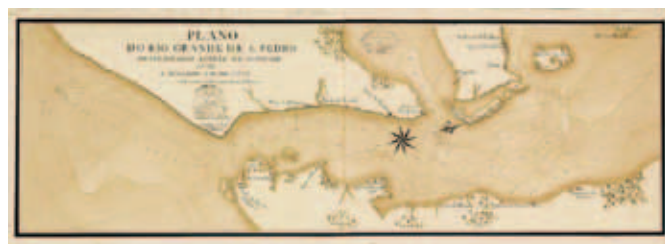
Figura 2. Plano do Rio Grande de S. Pedro principiado a tirar no anno de 1776 e acabado no de 1777 / [Pedro de Mariz de Souza Sarmento]. – Escala [ca. 1:34 000] – 1777. – 1 mapa : ms., color ; 24 x 68 cm. Direcção de Infra-estruturas do Exército, Lisboa, 4612-1A-10A-53.