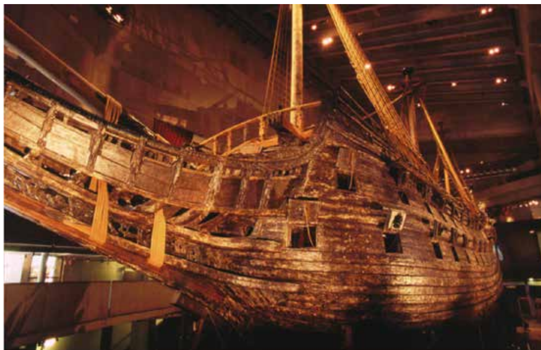
Figura 1 – Proa do Vasa (2004). Autor: Nick Lott O 3

“(…) está pleiteando, junto à Comissão de Limites da Plataforma Continental (CLPC) da Convenção das Nações Unidas sobre o Direito do Mar (CNUDM), a extensão dos limites de sua Plataforma Continental, além das 200 milhas náuticas (370 km), correspondente a uma área de 963 mil km 2 . Após serem aceitas as recomendações da CLPC pelo Brasil, os espaços marítimos nacionais poderão atin-