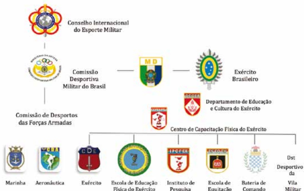
Figura 2 – Organizações Desportivas Militares do Exército Brasileiro e suas Ligações Técnicas entre as Forças Armadas

A Comissão de Desporto da Marinha (CDM) e a Comissão de Desportos da Aeronáutica (CDA) são órgãos do sistema de educação física das referentes Forças, que tem por missão assessorá-las quanto ao planejamento, direção, coordenação, fiscalizando as atividades de educação física e desportos, respectivamente na Marinha e na Força Aérea (CAPINUSSÚ, 1992).