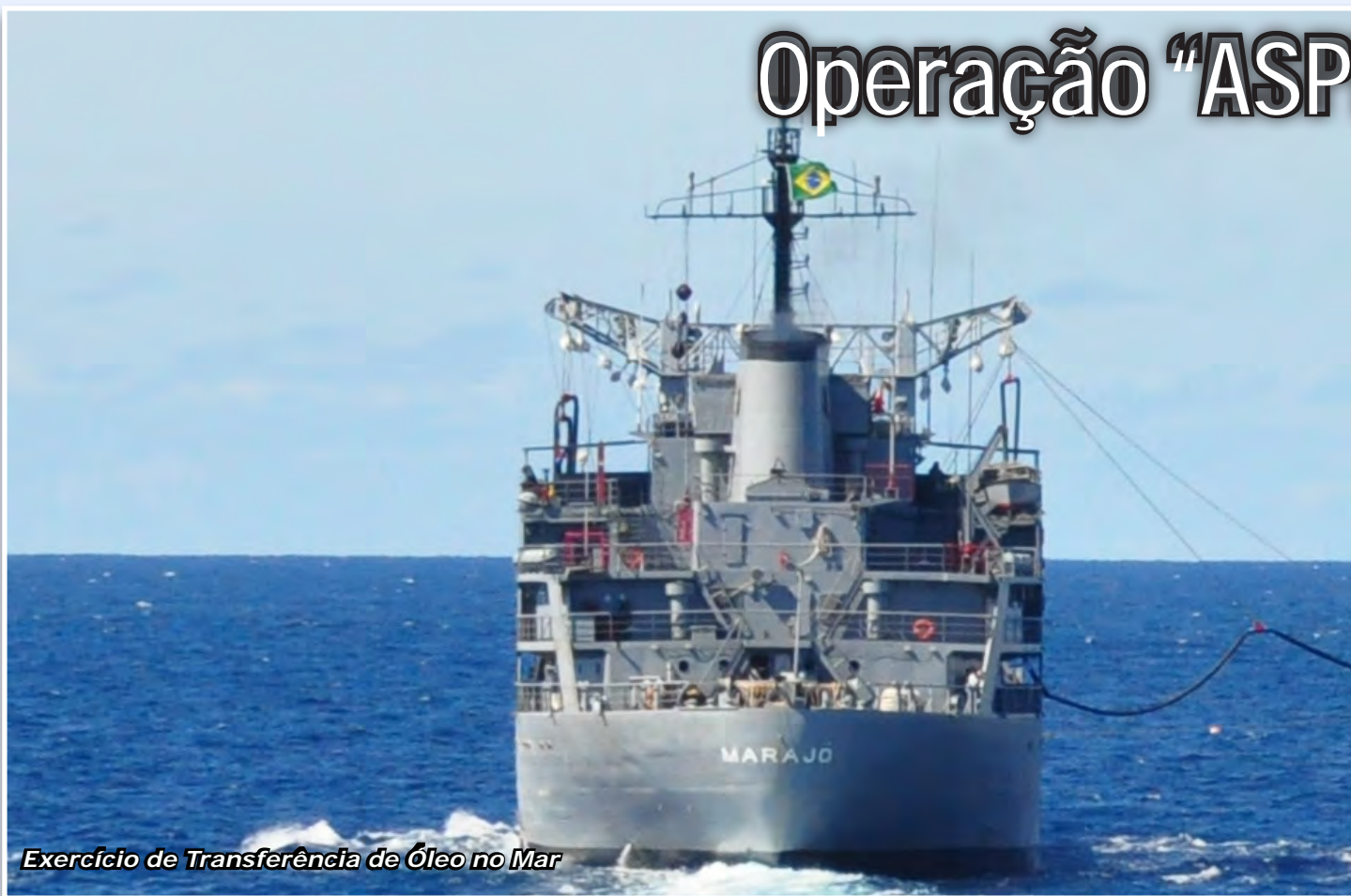
Exercício de Transferência de Óleo no Mar

Foi realizada, em janeiro de 2013, mais uma edição da Operação "Aspirantex", com o propósito de familiarizar os Aspirantes da Escola Naval (EN) com as atividades de bordo e com os principais exercícios e operações navais realizados no mar. A operação também contribui para a orientação dos Aspirantes, de modo que eles estejam mais seguros para optar entre os Corpos da Armada, de Fuzileiros Navais ou de Intendentes da Marinha.