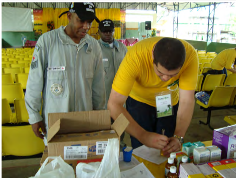
Militares da Marinha e integrantes do Projeto “Rondon”

Batizado com nome inspirado no trabalho do humanista Marechal Cândido da Silva Rondon, o projeto é uma iniciativa do Governo Federal. Coordenado pelo Ministério da Defesa, conta com a parceria de outros Ministérios, da Secretaria-Geral da Presidência da República e das Forças Armadas, que são responsáveis pela segurança e apoio logístico necessários às operações. O