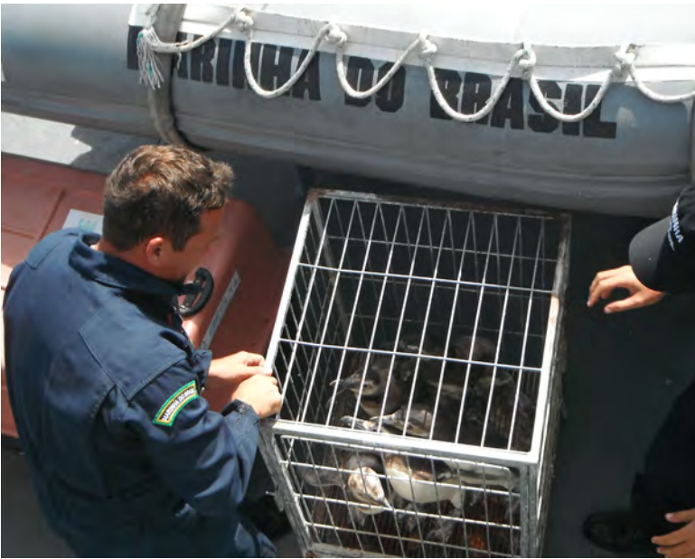
Soltura dos animais reabilitados

A Delegacia da Capitania dos Portos em São Sebastião, localizada no Estado de São Paulo, apoiou, no dia 23 de janeiro de 2013, a operação de soltura de 66 pinguins e um lobo-marinho, reabilitados pelo Instituto Argonauta para a Conservação Costeira e Marinha.