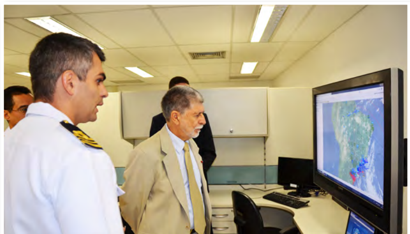
Embaixador Celso Amorim conhece as instalações do CASNAV

Na ocasião, o Ministro Celso Amorim assistiu a uma apresentação do Diretor do CASNAV, C. Almirante Almir Garnier Santos, sobre as áreas de atuação e os principais projetos desenvolvidos. Em