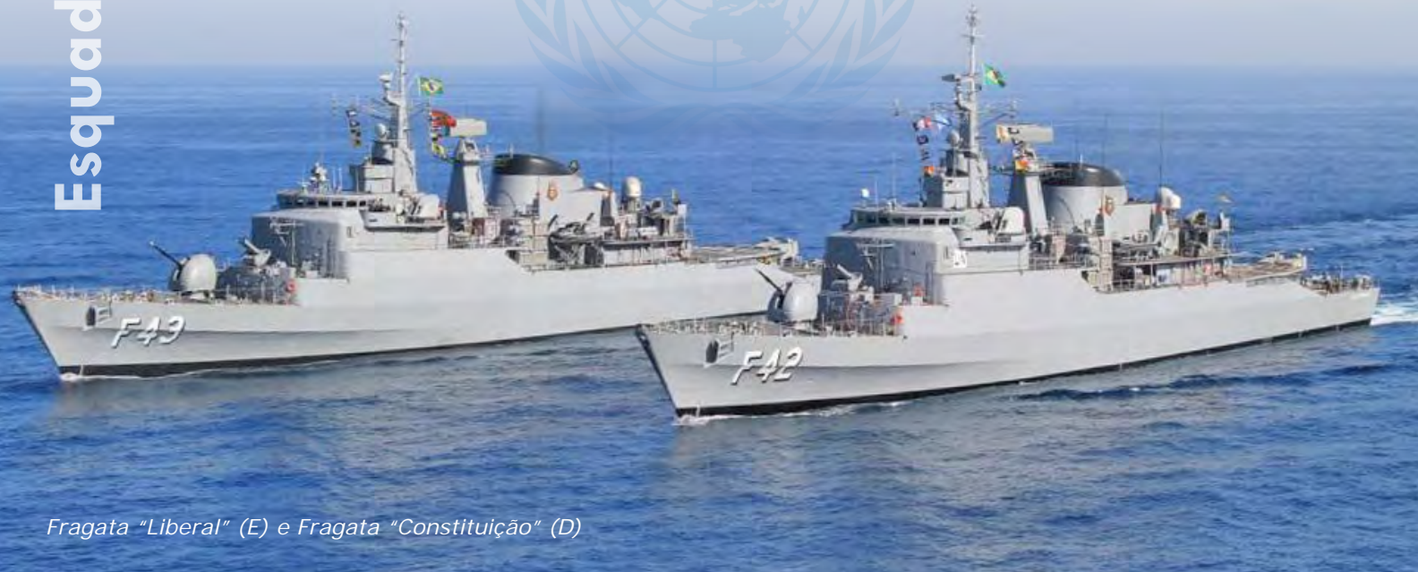
Fragata "Liberal" (E) e Fragata "Constituição" (D)

Após o término de sua participação como navio-capitânia da Força-Tarefa Marítima da Força Interina das Nações Unidas no Líbano (FTM-UNIFIL), por oito meses, a Fragata "Liberal" iniciou seu regresso ao Brasil, no dia 16 de janeiro de 2013, sendo rendida pela Fragata "Constituição".