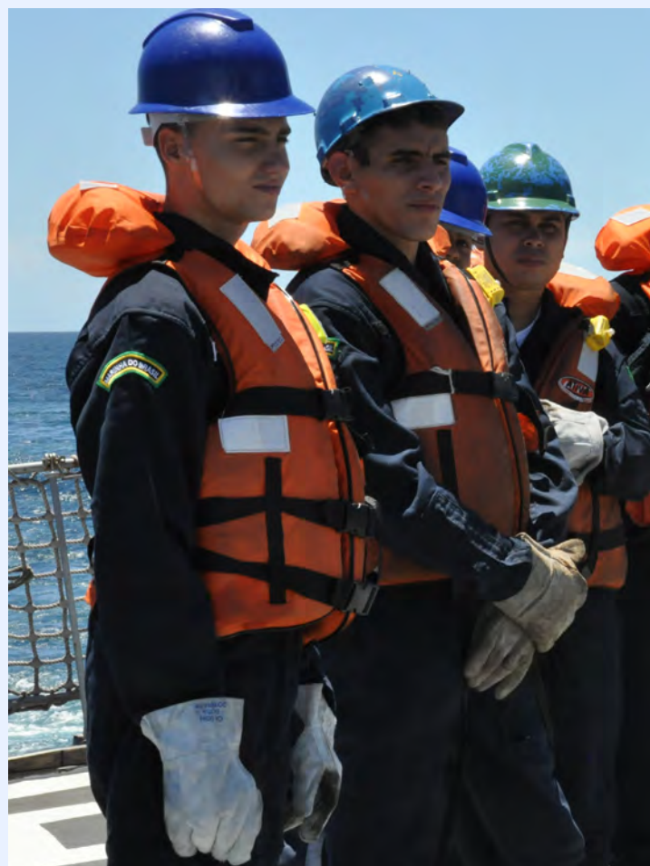
A operação envolveu Aspirantes dos 2º e 3º anos da Es

A quarta fase da operação teve início com a atracação do GT nos Portos de Itajaí e São Francisco do Sul, em