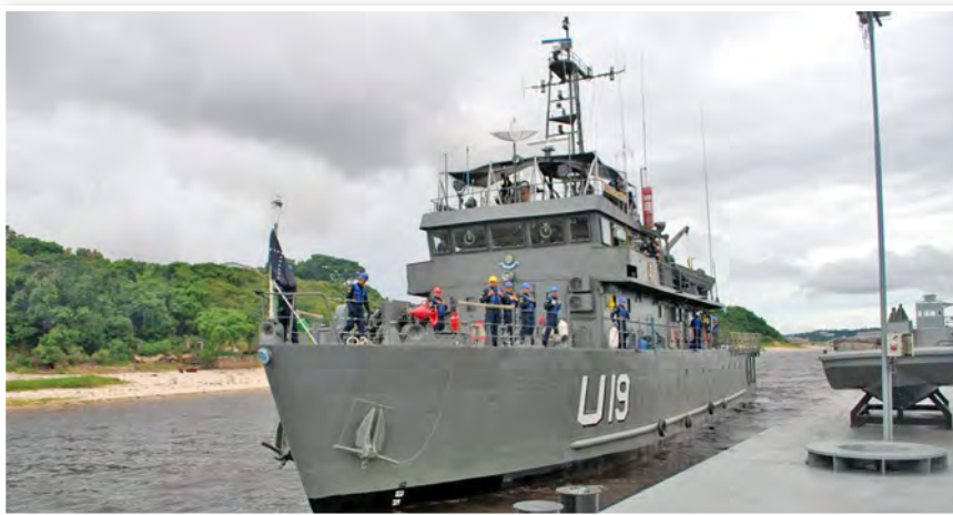
Navio de Assistência Hospitalar “Carlos Chagas” parte do cais da Estação Naval do Rio Negro, em Manaus (AM), com destino à Cruzeiro do Sul (AC)

Em 28 de janeiro de 2013, o Navio de Assistência Hospitalar (NAsH) “Carlos Chagas”, subordinado ao Comando da Flotilha do Amazonas, partiu do cais da Estação Naval do Rio Negro, em Manaus (AM), com destino à cidade de Cruzeiro do Sul (AC), para iniciar a 13ª edição da