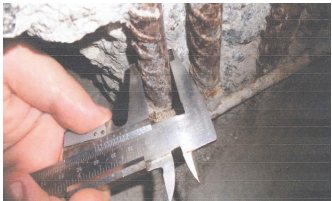
Figura 5 – Seção transversão da armadura longitudinal de um pilar.