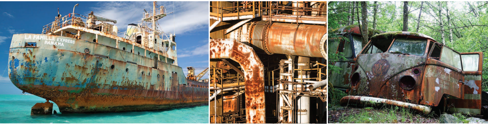
Figura 2 – Reação de corrosão.

material dúctil que pode ser deformável por processo de laminação, forja ou extrusão (MAINIER e LETA, 2001). Esse material, em contato com o ar ou com a umidade, torna-se um excelente eletrólito, o anodo, que nesse processo sofre a semirreação de oxidação, ou seja, cede elétrons com facilidade de sua estrutura atômica em um meio aquoso, úmido. Já o oxigênio, presente no ar atmosférico e na água, se comporta como um excelente catodo, material capaz de receber elétrons, compondo a semirreação de redução (GONZALEZ e TICIANELLI, 2005).