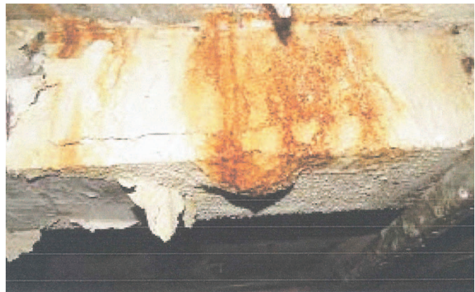
Figura 3 – Fase iniciação da corrosão.

A propagação é a fase em que a corrosão já está presente no aço e espalhada no elemento estrutural, produzindo o óxido de ferro (a ferrugem); nesse estágio, ocorre o deslocamento do concreto adjacente (Figura 4). Em nível mais avançado de propagação na estrutura, sem a adequada manutenção, a seção transversal do aço perde dimensão e, conseqüentemente, a capacidade de resistir aos esforços de tração, comprometendo a estabilidade da edificação (Figura 5).