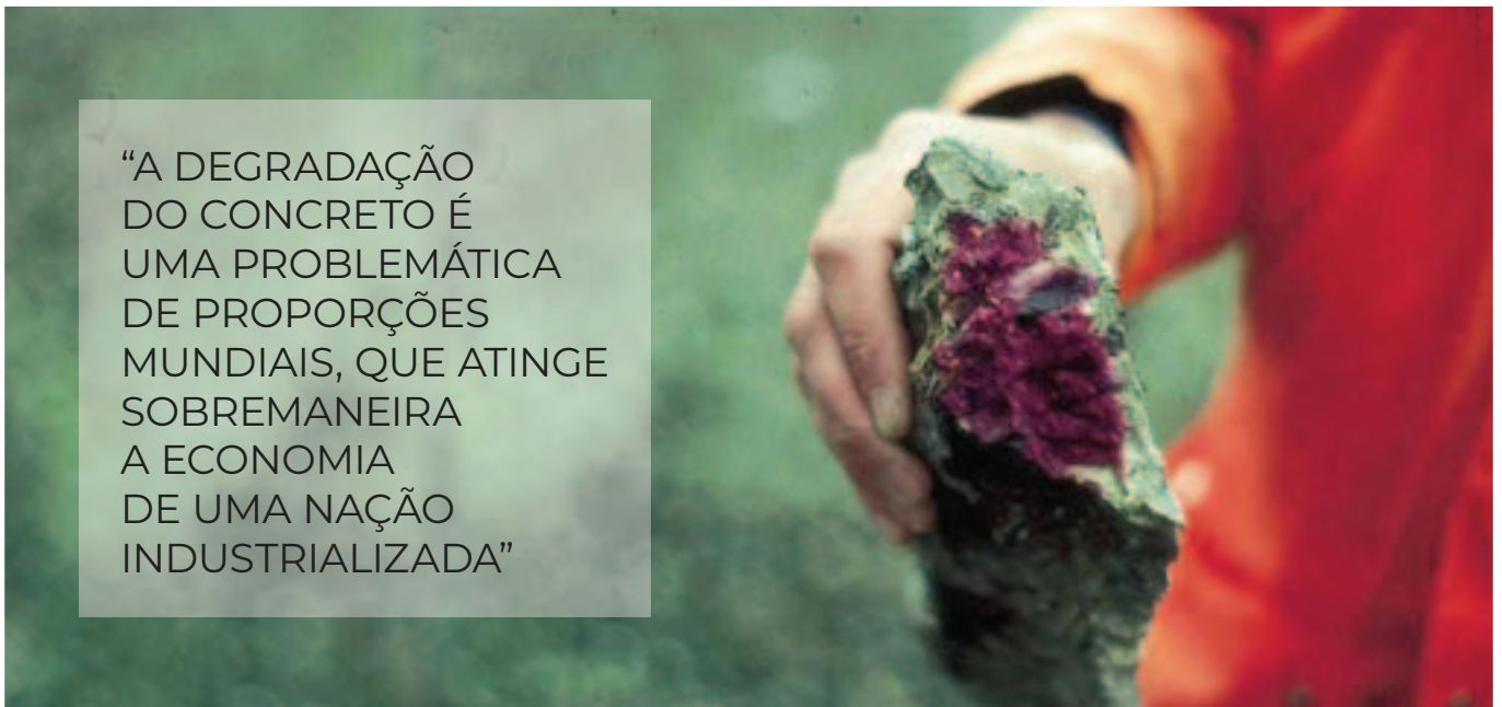
Figura 1 – Carbonatação no concreto.

sobremaneira a economia de uma nação industrializada, além de impor ao ser humano consequências gravíssimas, devido a acidentes ocasionados pela perda da capacidade portante da estrutura ou de parte dela, pelos processos degradativos que ocorrem devido a fatores como a carbonatação (Figura 1), o ataque por sulfatos e ácidos, muito comuns nas regiões costeiras, entre outros (RIBEIRO, 2018).