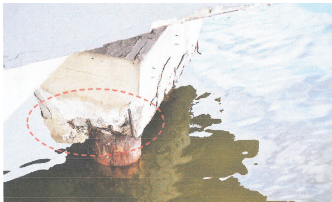
Figura 4 – Deslocamento do concreto adjacente.