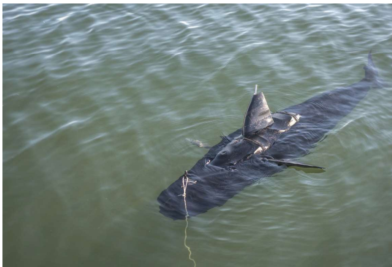
Figura 2 - UUV “ Ghostswimmer ”

comprimento de 5 pés, o “ Ghostswimmer ” pode atuar em profundidades de 10 a 300 pés com uma bateria de longa duração, e capacidade de operar de forma autônoma por longos períodos de tempo ou controlado remotamente via laptop através de um cabo de 500 pés.