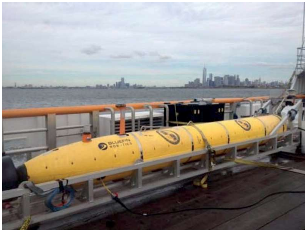
Figura 3 - UUV “Knifefish”

e o LDUUV “Snakehead” utilizado para vigilância, reconhecimento e inteligência.