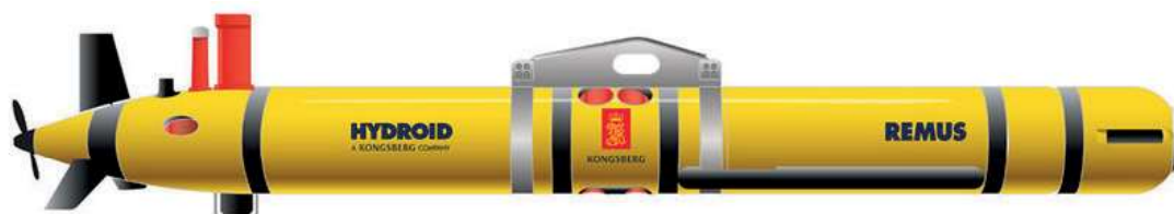
Figura 4 - UUV “Remus 600”