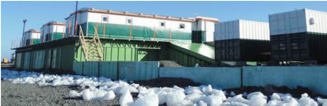
Módulos Antárticos Emergenciais instalados.

familiar por longo período vai demandar esforço das pessoas próximas para tolerar essa distância e administrar as questões familiares na sua ausência.