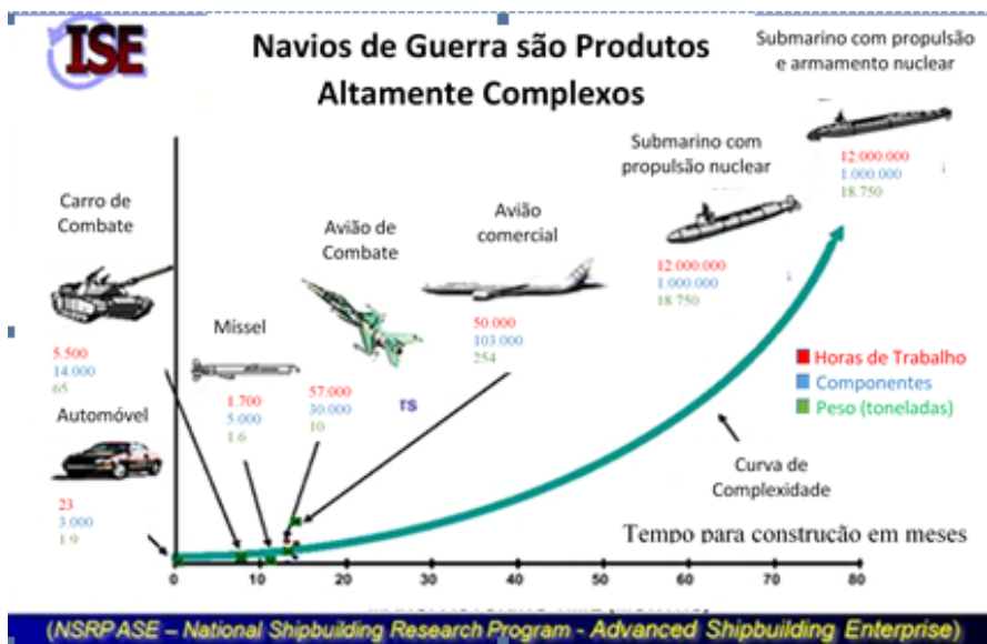
FIGURA 1 - A COMPLEXIDADE DO SUBMARINO COM PROPULSÃO NUCLEAR