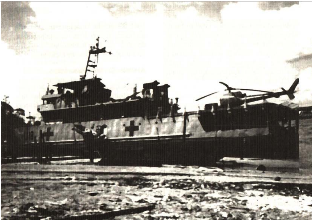
O Oswaldo Cruz “atracado” no seco, em Monte Dourado – Rio Jari, por conta da maré com amplitude de 5 metros

molho do peixe, que é acompanhado também do açai, tirado do açazeiro na hora.”