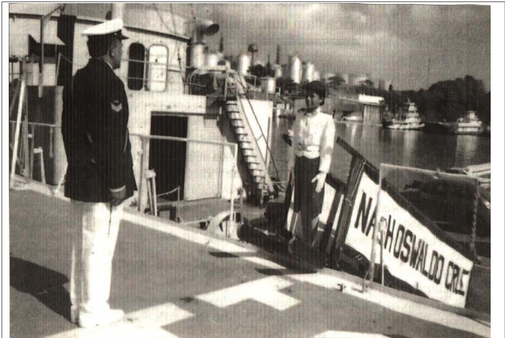
Na Estação Naval do Rio Negro – SG Joselito recebendo alunos do Colégio Militar de Manaus em visita ao navio em comemoração à Batalha Naval do Riachuelo.

Claros ou escuros, arriscados ou calmos, os rios comandam toda a vida de quem deles necessita para ir de um canto a outro da Amazônia. Por exemplo, é impossível ultrapassar a cidade de Boca do Acre, às margens do Purus, navegando por este rio, pois a partir daquele ponto ele não é mais navegável, “e isso no período das cheias”. Entretanto, há rios que na época das cheias chegam a atingir profundidades de até 130 metros, como é o caso do trecho do Amazonas que fica em frente a Óbidos.