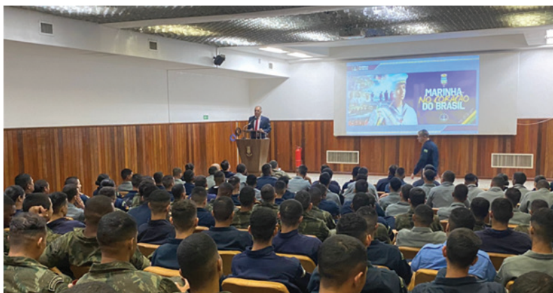
Foto 3 – Desembargador Josaphá Francisco dos Santos em palestra no Comando do 7º Distrito Naval

resiliência, é possível superar qualquer obstáculo e construir uma trajetória próspera e feliz. Ele ensina que o sucesso não deve ser confundido com arrogância ou egocentrismo, mas que a verdadeira grandeza reside na humildade, na gratidão e na capacidade de servir aos outros com generosidade e humanidade.