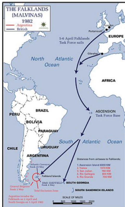
Figura 3 – Deslocamento da Task Force 317

sobre as ilhas (MAIA, 2018) e vence a guerra. Vidigal (2002), citando a avaliação do historiador Nigel West sobre a guerra de 1982, evidencia que, “se a Argentina tivesse esperado até outubro ou novembro para iniciar a ocupação, a Grã-Bretanha não teria como reagir”, pois já teria reduzido a sua frota naval em cumprimento ao plano de contingência de gastos. Em 2013, foi realizado um plebiscito nas Ilhas Falklands (Malvinas) para que os kelpers 4 decidissem se elas permaneceriam sob domínio britânico, o que foi aprovado. Apesar disso, os argentinos afirmam que o princípio da