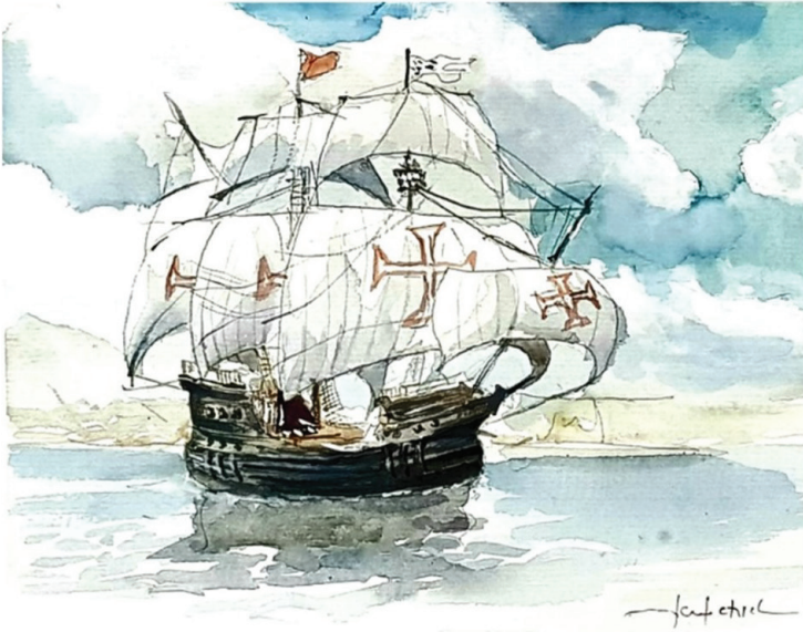
Figura 1 –Aquarela de Fernando Patrial (2024)

uma vez que conheceu pessoalmente alguns integrantes das navegações.