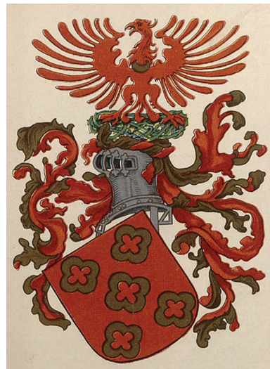
Figura 3 – Brasão da Família Lemos