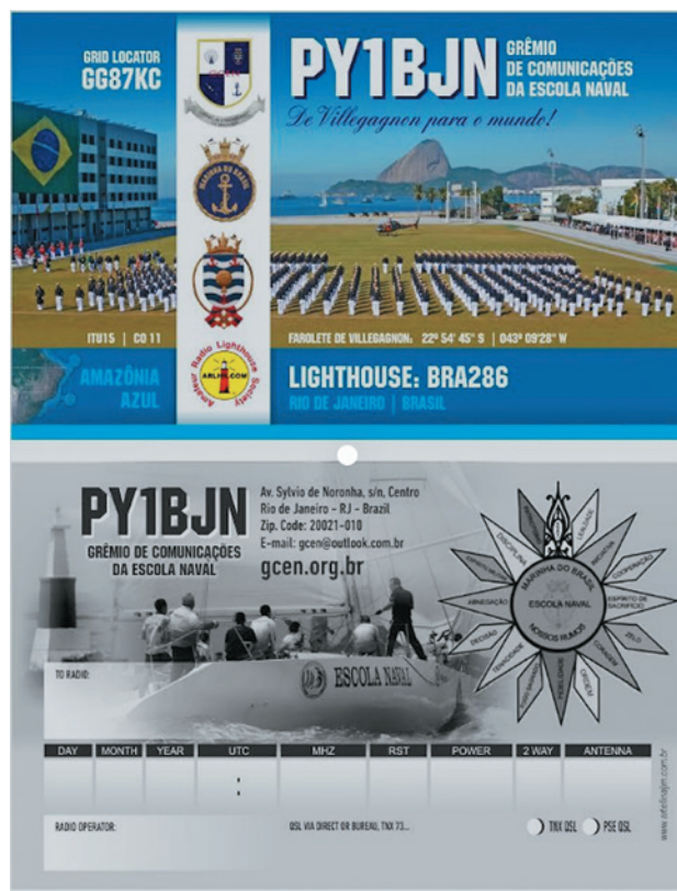
Figura 2. Cartão de confirmação de contato da EN