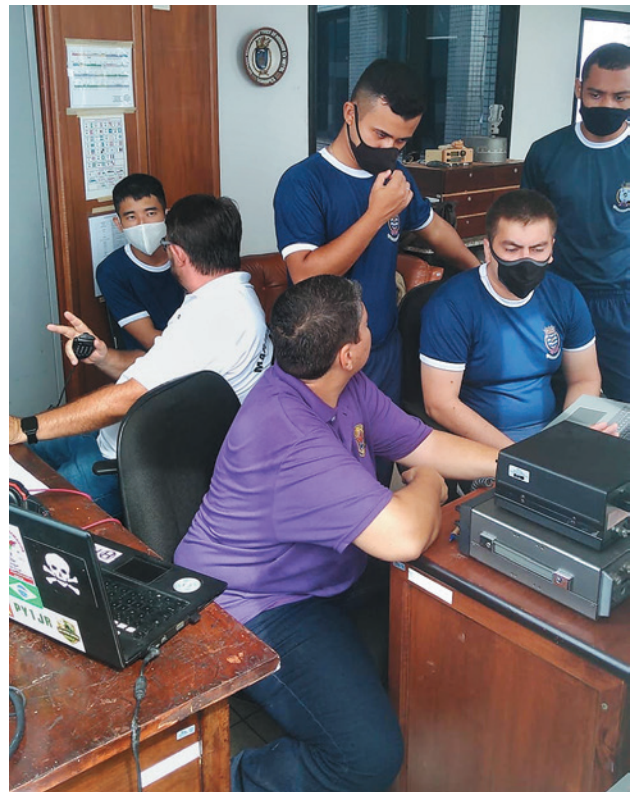
Figura 3. Radioamadores voluntários passando conhecimento aos Aspirantes

Hoje temos uma equipe de radioamadores credenciados pela Escola Naval a frequentar e operar a estação PY1BJN, contribuindo, desta forma, na formação dos futuros Oficiais da Marinha do Brasil, propiciando ainda o ingresso de novos adeptos a esse hobby . Uma atividade realmente recompensadora e que engrandece o radioamadorismo brasileiro.