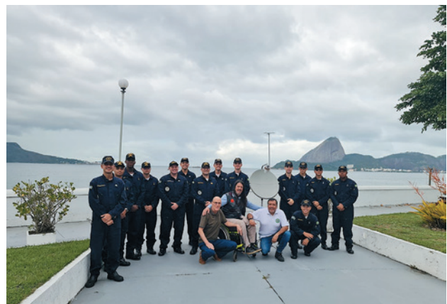
Figura 5. Em JUN 22, Aspirantes e radioamadores após o contato via satélite com a Estação Antártica Alemã