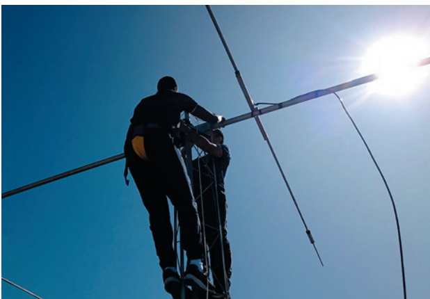
Figura 4. Aspirantes realizando manutenção em antena